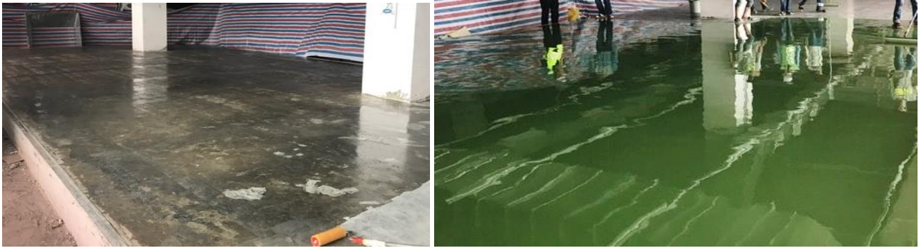
Picture: Mock-up SikaFloor 264 at new terminal in Da Nang International airport

Owner/Chủ đầu tư: AHT Contractor/Nhà thầu: Handcorp, Hoa Binh Floor area/Diện tích sàn: 3,000 sqm Period/Giai đoạn: 2015 – 2017