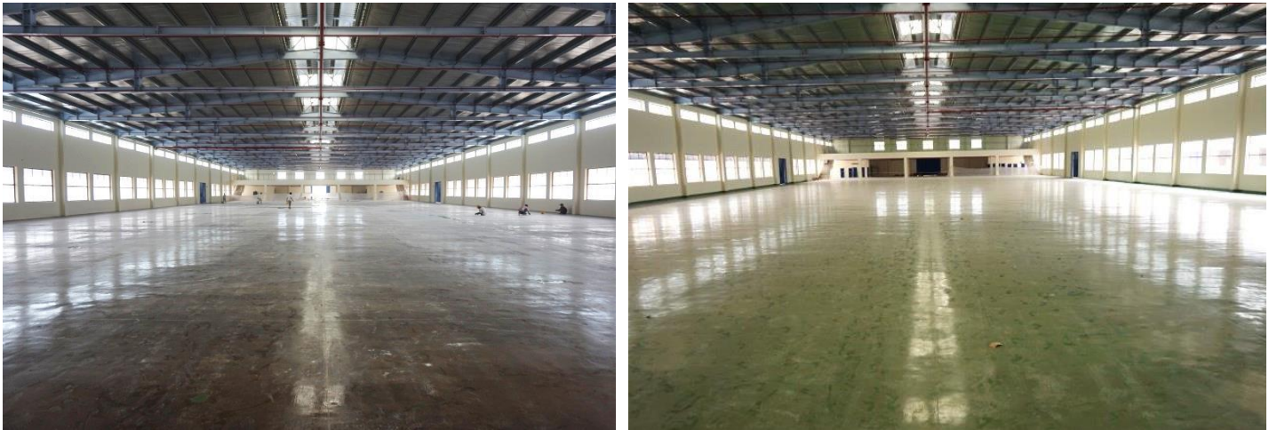
Picture: SikaFloor®-161 and SikaFloor®-264 was applied on floor of Dona footwear standard factory

Owner/Chủ đầu tư: Vietnam Dona Standard Footwear Contractor/Nhà thầu: Tradeco Floor area/Diện tích sàn: 14,000 sqm Period/Giai đoạn: 2014 – 2016