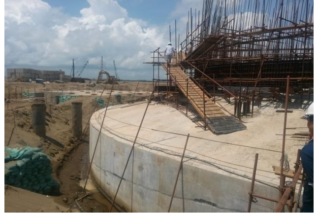
Picture: Duyen Hai Thermal-Power Plant