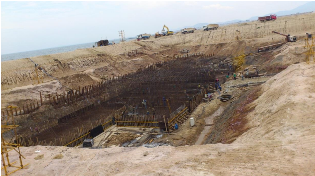
Picture: The treatment system for sea water into fresh water

Owner: EVN Main/Sub Contractor: Shanghai Electric Company (SEC), Hubei Electric Power Engineering Corp (HEPEC), CSCEC No.2 Designer/Consultant: PECC2 Quantity supplied: 38 tons