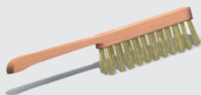
Bàn chải sắt