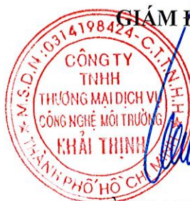
HUỶNH CHÂU QUÍ

Không được trích sao một phần hoặc toàn bộ phiếu kết quả thử nghiệm này nếu không có sự đồng ý bằng văn bản của Khai Thinh Entechco Kết quả thử nghiệm ghi trong phiếu này chỉ có giá trị đối với mẫu thử nghiệm Thời gian lưu mẫu 05 ngày kể từ ngày trả kết quả, không lưu đối với mẫu khí và vi sinh Hết thời gian lưu mẫu, Phòng thử nghiệm không giải quyết việc khiếu nại kết quả phân tích