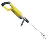
Máy trộn điện tốc độ chậm