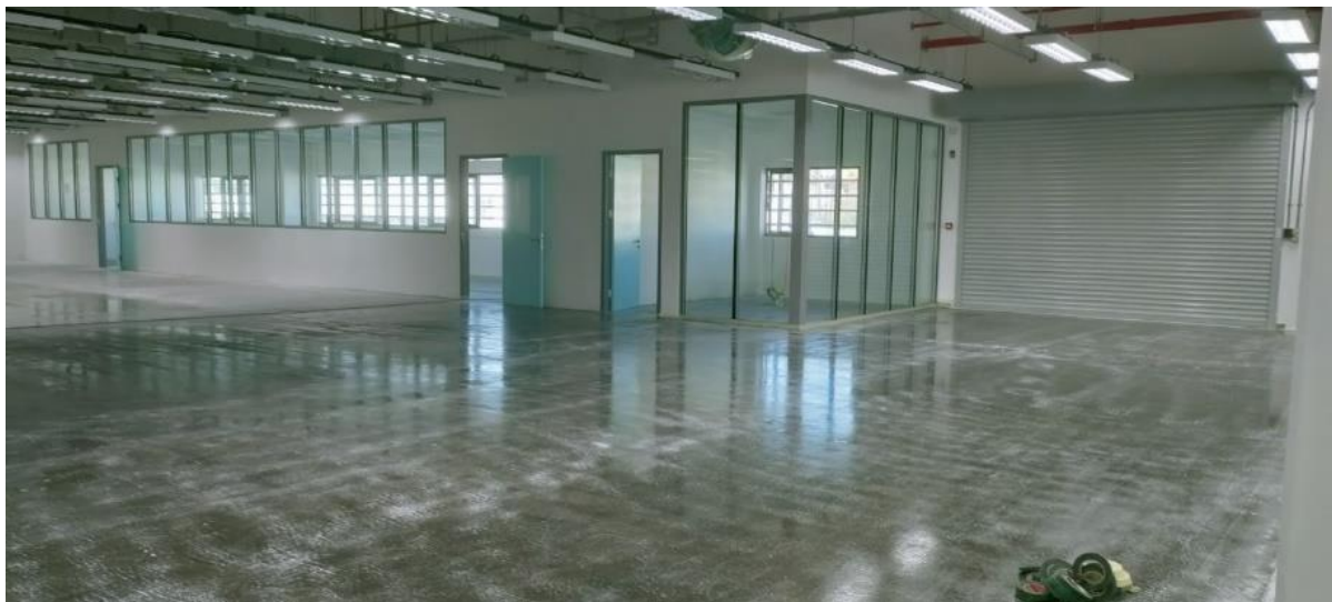
Caption: Sikafloor®-161 HC