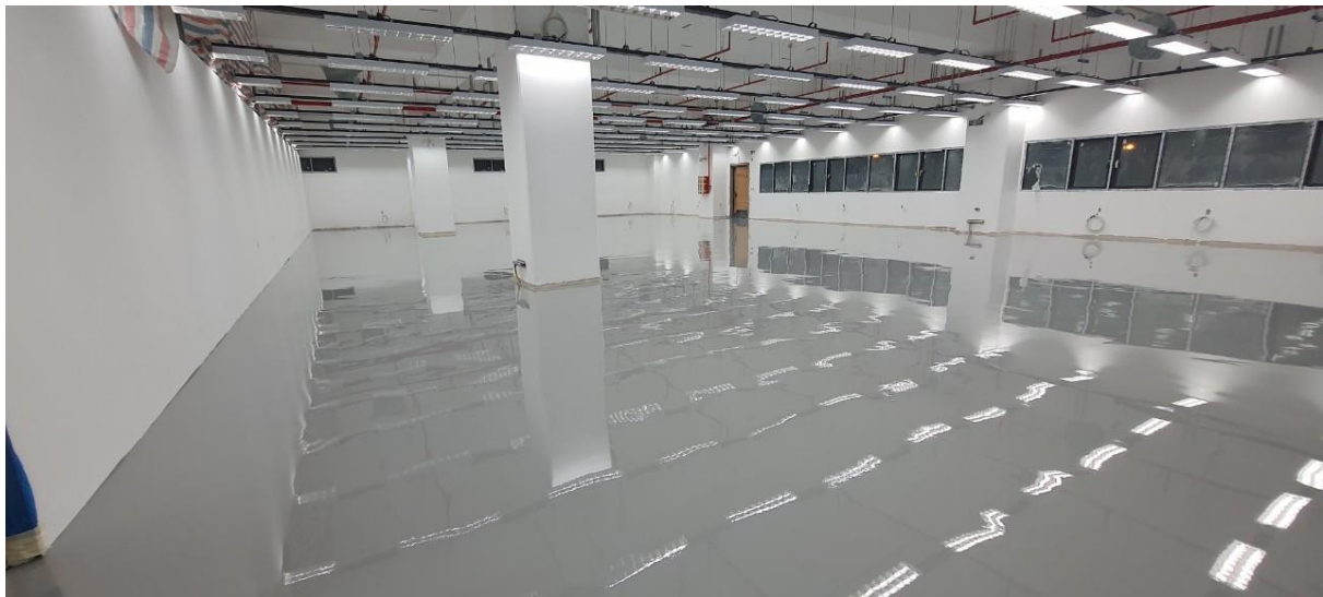
Caption: Sikafloor®-235 ESD